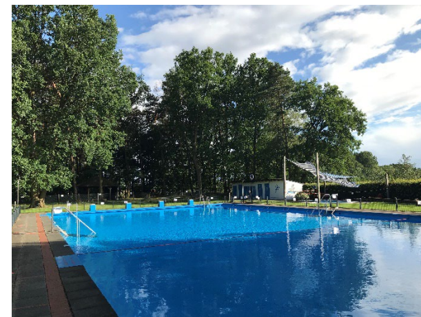
Waldbad - Wulfelade

Private Eigentümer können nach Beschluss des Dorfentwicklungsberichtes für Maßnahmen an ortsbildprägenden Gebäuden eine Förderung von bis zu 30 % erhalten.