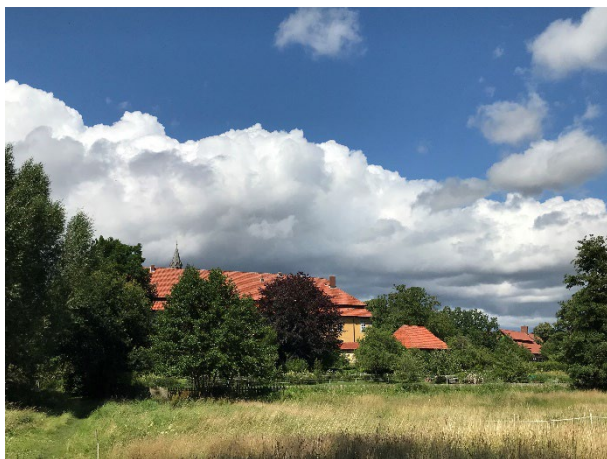
Blick auf das Kloster - Mariensee

Etwas gemeinsam für die Dorfgemeinschaft schaffen, gemeinsam mit anderen Dörfern zum Erhalt der sozialen Infrastruktur beitragen oder neue Wege gehen.